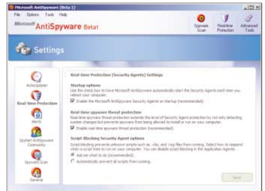
▲ Pokud jde o odstraňování spywaru, nabídl antispywarový nástroj od Microsoftu (zdarma) jen chabý výkon, ale poskytl dobrou ochranu před podezřelým chováním.

Z hlediska jednoduchosti ovládání se na nejvyšší příčce umístila souprava od firmy Panda: odstraňuje totiž nalezený spyware a adware, nevyžaduje však zásahy uživatele. Standardní nastavení lze ovšem změnit tak, aby bylo možné rozhodovat případ od případu. Souprava ZoneAlarm zobrazuje řadu výstražných hlášek, které vyžadují vaši reakci, což může být poměrně náročné, nerozumíte-li do hloubky problematiky bezpečnosti. Ani rozhraní McAfee nás nenadchlo. Ikona, která se objevuje v oznamovací oblasti Windows (vedle hodin), totiž nespustí antispywarový skener.