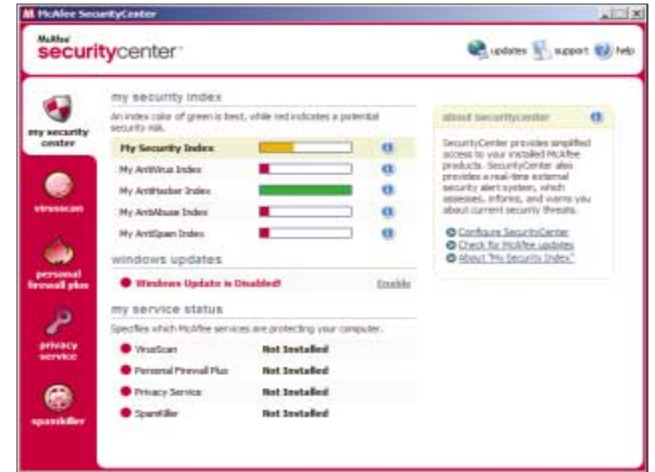
▲ Ikona McAfee na systémové liště se napojí na SecurityCenter, kde ovšem nenajdete program AntiSpyware 2006.

CounterSpy, McAfee, Spybot, Spy Sweeper, Spyware Doktor, Windows AntiSpyware a souprava ZoneAlarm – všechny tyto prostředky a nástroje poskytují ochranu monitorující chování počítače. Jednoznačně se ukázalo, že neúčinnější je Spy Sweeper.