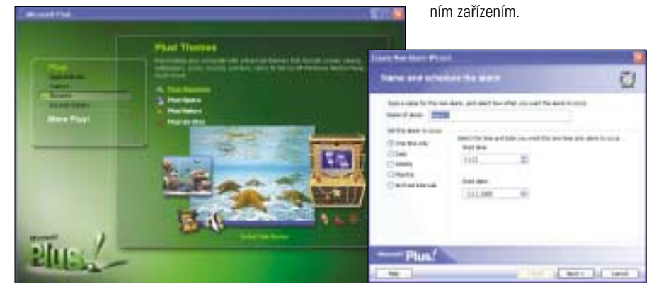
▲ Prostředí pro práci s MS Plus!.

Mezi další aplikace, které najdete přímo v menu Start, patří poměrně podařený Alarm Clock . Snadno v něm nastavíte události, na které jste poté volitelně upozorněni. Budík zvládá i opako-