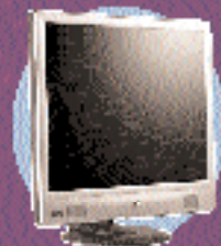
LCD Monitor 1971E*

Hry nejen hraje - pro ně je! Nemůžeme si je zrychlit pohyb Vašich prstů nebo postřeh, ale můžeme Vám zajistit monitory, které reagují s citovostí blízkí se neuvěřitelně vysokém u potenciálu očí hráče. Nabídneme Vám zcela nové vizuální dimenze v grafice i v animaci - s detaily ostrými jako bítva. Naším cílem je poskytnout Vám hlubší, bohatší a opravdovější zážitek ze hry. Vyzkoušejte Senseye, špičkovou obrazovou technologii se zdokonalenými vlastnostmi pro ladění barvnosti, kontrastu a ostrosti obrazu - Color Management Engine, Contrast Enhancement Engine a Sharpness Enhancement Engine. Tato kombinace posouvá naše monitory o další krok blíže ke schopnostem lidského oka. Navštivte nás na BenQ.cz