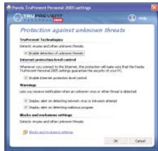
▲ Tru Prevent Personal 2005: rozpozná podle jejich typického chování i nové druhy virů a trojských koní.

tažmo klientech na pevném disku a posílá je autorovi trojana, který tyto informace může nejrůznějšími způsoby zneužívat. Jedná-li se o údaje o adrese a datu narození, může si podvodník například otevřít účet na Ebay. Mohl by je po-