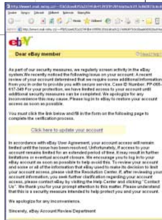
▲ Typický phishingový e-mail.

I přes častá varování se stále někteří uživatelé nechají autentičticky působícími e-maily svést ke klikání na linky ve zprávě. Na následujících internetových stránkách pak zadávají osobní údaje. Příkladem lze bohužel najít až příliš mnoho. Často se o pozdvižení starají e-maily, které vypadají, jakoby pocházely od bankovních domů. Paradoxně varují před podvodníky a prosí uživatele, aby klikli na odkaz a zde „vyplnili způsob doplňkové autorizace“. Odkaz vypadá na první pohled stejně, jako by vedl k webové stránce opravdové banky. Při důkladném pohledu na URL však zjistíme, že se jedná o trik. Pokud se dostanete na zmíněné stránky, podvod často ani na první pohled nepoznáte. Všechno je dokonale napodobeno – stránka působí autenticky. Ani originální poznámka „pozor na podvodníky!“ s varováním před zfalšovanými e-maily zde ironicky nechybí. Do formuláře má zákazník mimo jiné zadat číslo konta, on-line PIN a TAN. Každého by to mělo zarazit hned při přihlašování, nejpozději při