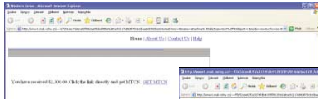
▲ Opravdu takovýmto zprávám věříte? V žádném případě na takovéto odkazy neklikujte.

dat i kriminálními organizacím, které si cíleně vybírají především majetné zákazníky.