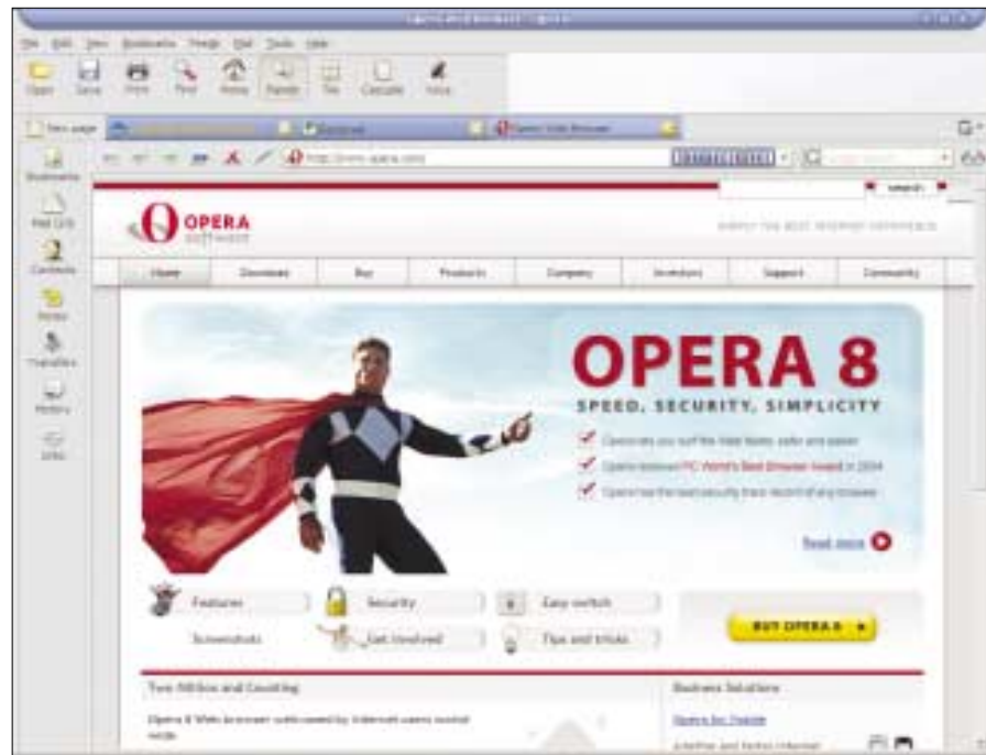
▲ Hlavní okno aplikace. Uprostřed jsou zobrazovány stránky, vlevo je panel s funkcemi. Nad ním najdeme navigační tlačítka a prostor pro reklamu.

Opera pro PC, respektive pro Windows, existuje ve dvou verzích (představovaných jednou aplikací). První je volně šiřitelná podoba, která je adware. To znamená, že výměnou za bezplatné používání aplikace zobrazuje reklamní proužek. Druhá verze je této nectnosti zbavena. Dlužno podotknout, že konverze programu z volné do placené probíhá pouze zadáním sériového čísla, po