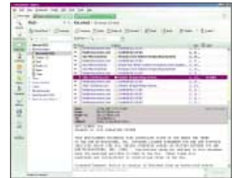
▲ Výhodou Opeře je i poštovní klient.

psat odpověď, aniž by bylo nutné zvláště otevřít zprávu, na kterou odpovídáme, co víc, aniž by nám tato zpráva zmizela z očí.