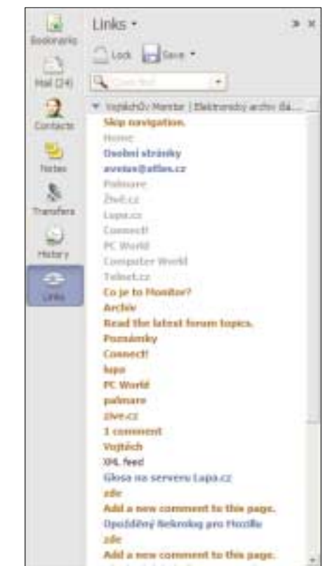
▲ V bočním panelu si můžeme zobrazit všechny odkazy, které se nacházejí na právě zobrazené stránce. To je praktické hlavně pokud se ve stránce špatně orientujeme.