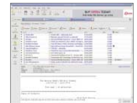
▲ Toto je hlavní okno Opeře v režimu poštovního klienta. V dolní části se nachází prostor pro napsání rychlé odpovědi na přichodící e-mail.

Opera 8 nepředstavuje oproti předchozí verzi zásadní evoluční krok. Skutečnost, že prohlížeč za dva týdny od svého uvedení zaznamenal dva miliony stažení (a následný pokus ředitele o přeplavání Atlantiku po prohrané sázce), naznačuje určitý zájem. Kolik uživatelů u Opeře skutečně zůstane, je ovšem jiná otázka. Opera 8 je kvalitní, výkonný a rychlý prohlížeč. Pokud jde o bezpečnost, netroufám tak krátce po uvedení vyslovit nějaký názor, pokud jde o kompatibilitu, od poslední verze se zlepšila, leč dokonalá stále není a asi nikdy nebude. Kdyby v bezplatné Opeře nebyl reklamní proužek a existovala česká verze, byla by to skvělá alternativa k Firefoxu a možná i k Internet Exploreru. V každém případě ji doporučujeme vyzkoušet, protože se jedná o vyspělý a velmi dobře zvládnutý software. 5 0404/BAM