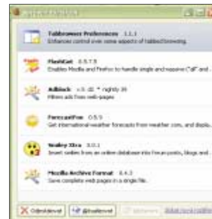
▲ Správce rozšíření prohlížeče.

Rozšíření prohlížeče můžeme v současné době rozdělit na tři části. Jsou to plug-iny, doplňky a vzhledy. Pod pojmem plug-iny se v případě webových aplikací obvykle rozumí kusy programo-