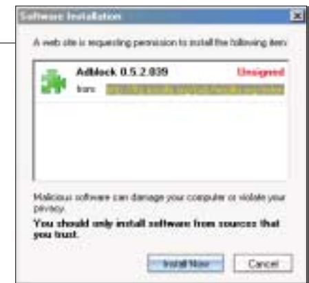
▲ Instalace doplňku Adblock.

Po klepnutí na odkaz s doplňkem prohlížeč zobrazí varovný dialog. Po jeho potvrzení proběhne stažení a samotná instalace. Doplňek se objeví i ve správci rozšíření. Z tohoto správce jej můžeme odinstalovat nebo také aktualizovat. Při tomto procesu je Firefox schopen najít svou novější