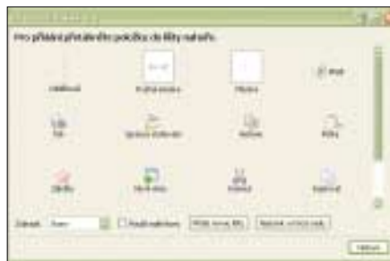
▲ Výběr tlačítek, vlastní nastavení.

Další nastavení prohlížeče můžeme provést prostřednictvím okna Možnosti , které je dostupné z menu Nástroje . V něm se nachází většina voleb aplikace a především nastavení jejího zabezpečení. Nastavit můžete chování aplikace při otevření, její nastavení jako výchozí prohlížeč, chování při stahování souborů, zpracování webových stránek a mnoho dalšího. Pokud budete chtít využívat prohlížení v panelech (což většina uživatelů chce), doporučujeme jednoznačně nastavit zobrazení panelů i v případě, že je otevřený pouze jeden. Značně si tím práci s panely usnadníte