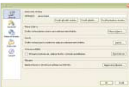
▲ Položka Možnosti v browseru Firefox.

Ve Firefoxu je integrovaná čtečka hlaviček zpráv ve formátu RSS. Tato čtečka se vyvíjela různým