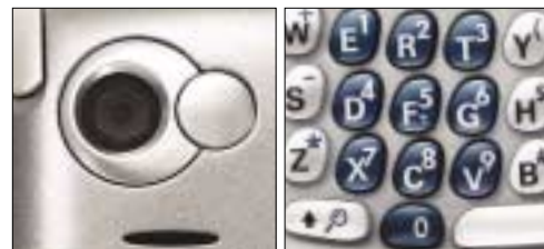
Vestavěný fotoaparát a klávesnice prošly mírnou modernizací.

K titulu nejdokonalějšího smartphone na trhu chybí jen pár krůčků. S ohledem na cenu MDA Compact bychom ale dlouho váhali, zda za roztomilé Treo 650 utratit osmáct tisíc Kč.