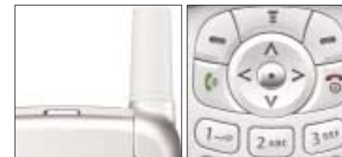
Pro „Moto“ typická anténka a vcelku příjemný ovladač.

Pokud hodláte ušetřit a nemůžete si vybrat mezi zlevněnými staršími modely, které trh nabízí, pak může být Motorola vaším favoritem. Nenabízí téměř nic, ale také téměř nic nestojí.