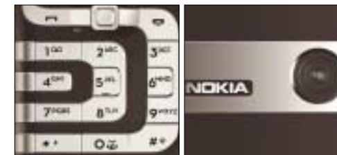
Nokia zaujme netradiční klávesnicí a fotoaparátem.

Pokud se vám N7260 líbí, nemusíte třikrát váhat, neboť vás svými funkcemi nezklame. Pokud ale styl tohoto mobilu není vaším gusem, pak se mu obloukem vyhněte. Při bližším setkání vás totiž ničím výrazně nepřekvapí.