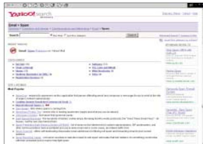
▲ ...pokračovat můžete na webu Yahoo.com