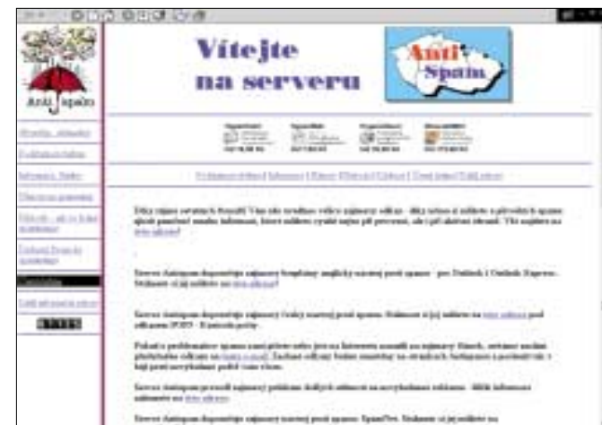
▲ Na serveru www.antispam.cz se vyplatí začít....