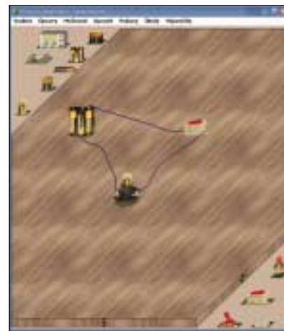
▲ Model jednoduchého obvodu ve 3D. Baterie, spínač a žárovka.

na experta přes obvody. Jako uživatel Edisona máte totiž k dispozici nejen nekonečné klubko drátů, ale i různých zdrojů, konektorů, LED diod, tranzistorů, rezistorů, osciloskopů, pojistek, potenciometrů a jiných serepetiček, na které si vzpomenete. Většina z nich svým vzhledem odpovídá skutečným předlohám. Na bateriích třeba najdete značku jednoho z jejich předních výrobců (že by reklama?) a u některých přístrojů zase můžete hýbat „čudlíky“ nebo i jinak ovlivňovat jejich vlastnosti jako je třeba odpor, napětí, apod. Ovládání je řešeno hlavně pomocí myši a uživatelské rozhraní je zaměřeno jak na laiky, tak i na profesionály. Obrazovka je rozdělena na dvě logické části. Levé okno zobrazuje 3D perspektivní pohled na pracovní plochu (stůl), která je obklopena policemi se součástkami po obou