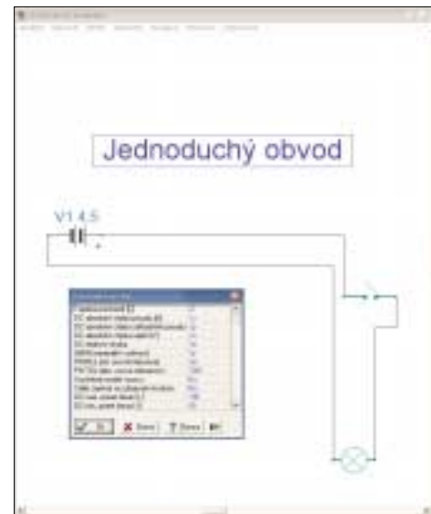
▶ Ten samý obvod ve schematicém zobrazení s možnostmi nastavení analýzy obvodu.