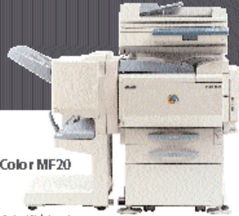
OLIVETTI Id-Color MF20

barevný kopírovací stroj / skener, rychlost 31 str./min. č./b, 30 str./min. barevně, formát A3+, zoom skenem po 0,1%, 2 typy kontrolerů pro kancelářské nebo profesionální grafické prostředí, vynikající ostrost kopíí a tisku, jemné odstupňování polotónů, efektivní síťová správa, ochrana provozu pomocí PIN kódů