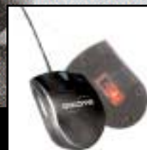
Sprinter optická myš

Počítačové tašky a příslušenství pro každého.