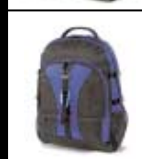
Bac Pac Jump batoh na notebook

DICOTA EASTERN EUROPE, s. r. o. Na Lysině 25, 147 00 Praha 4 Tel.: +420-261 227 763 Fax: +420-261 227 767 E-mail: dicota@dicota.cz