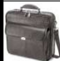
Ultra Case S brašna na notebook