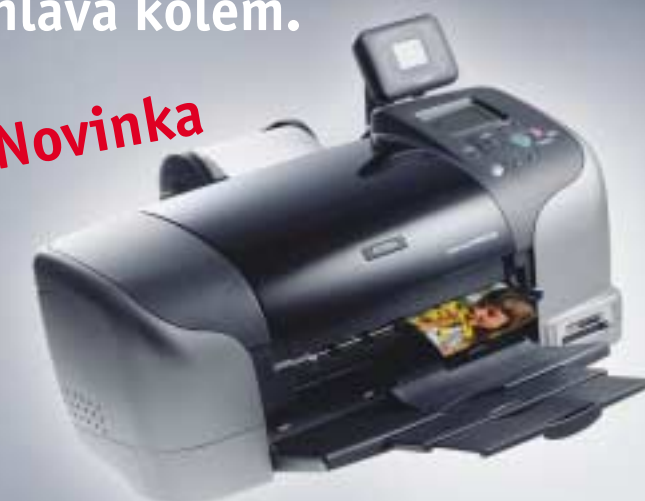
EPSON Stylus Photo 925*