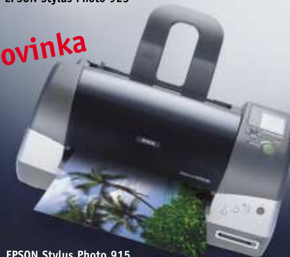
EPSON Stylus Photo 915

Své nejlepší snímky můžete tisknout s optimalizovaným rozlišením až do 5760 dpi**.