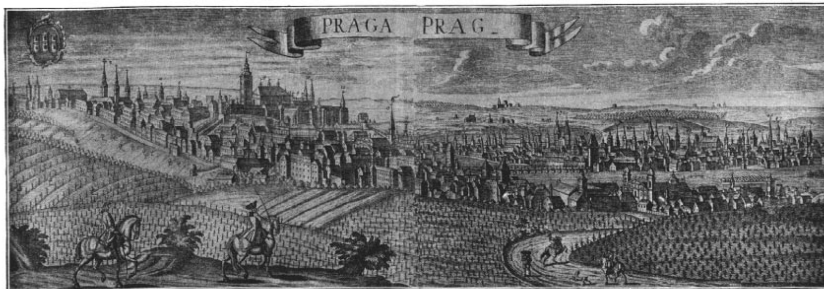
Pohled na Prahu na počátku XVIII. stol. (Ryl Krištof Haffner v Augšpurce.)