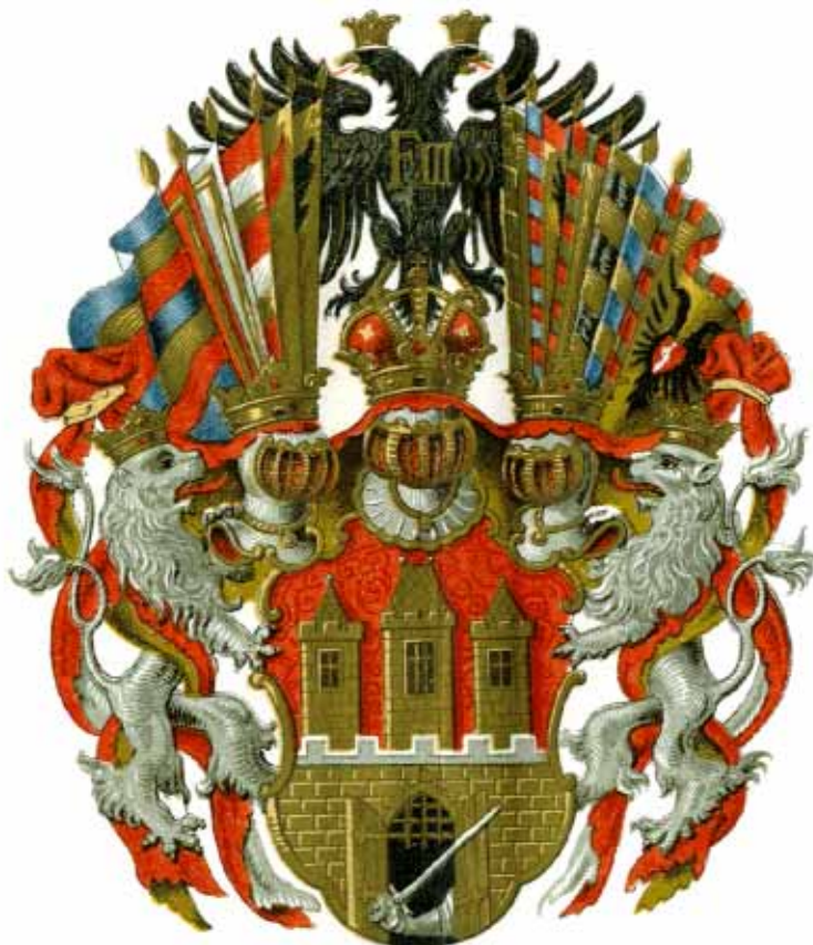
1. Znak Starého města Pražského z r. 1649. a nynější znak obce Pražské.