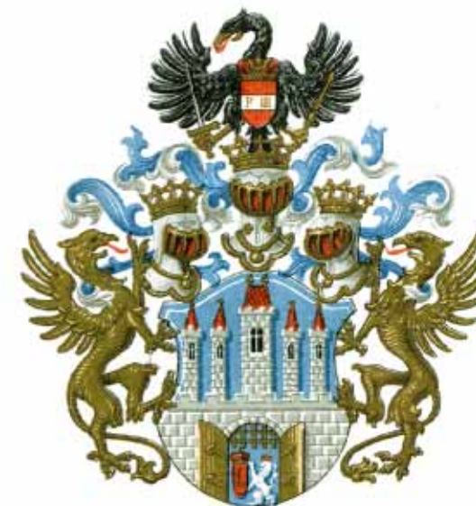
3. Znak Menšího města Pražského z r. 1657.