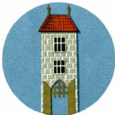
4. Znak města Hradčan ze XVI. století.