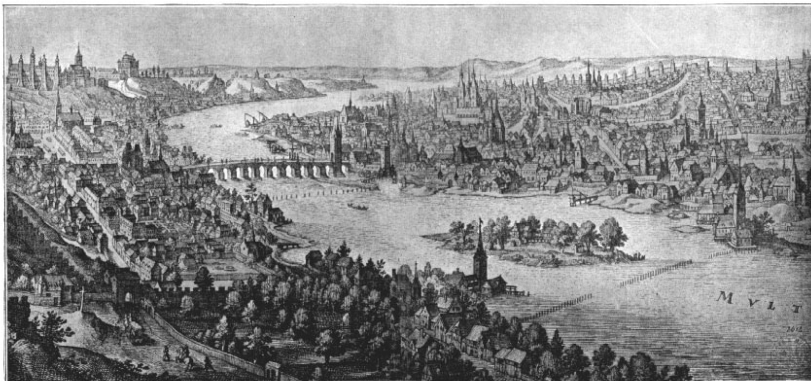
Praha na počátku XVII. stol. (podle rytiny Sadelerovy).