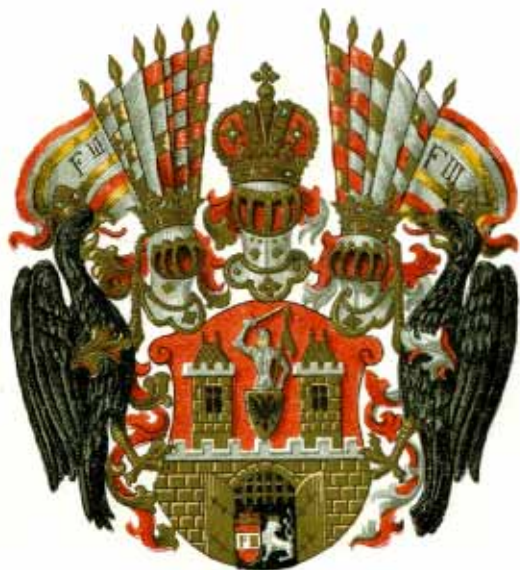
2. Znak Nového města Pražského z r. 1649.