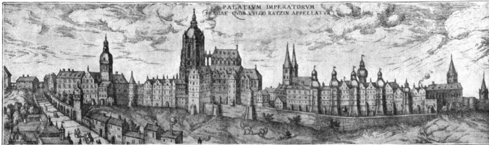
Hrad královský r. 1598. (Z knihy Brauna a Hagenberga »Civitates orbis terrarum«.)