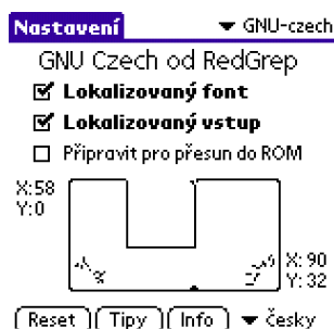
Obrázek 2: GNU-czech

Na vašem kapesním počítači spusťte aplikaci Preferences (Nastavení) . Ze seznamu v pravém horním rohu vyberte položku GNU-czech . Zaškrtněte políčka Lokalizovaný font a Lokalizovaný vstup . Vraťte se do správce aplikací (nemusíte používat tlačítko Reset ).