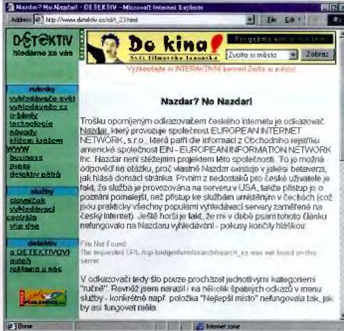
Obr. 3: Příklad konkrétního článku o jedné vyhledávací službě