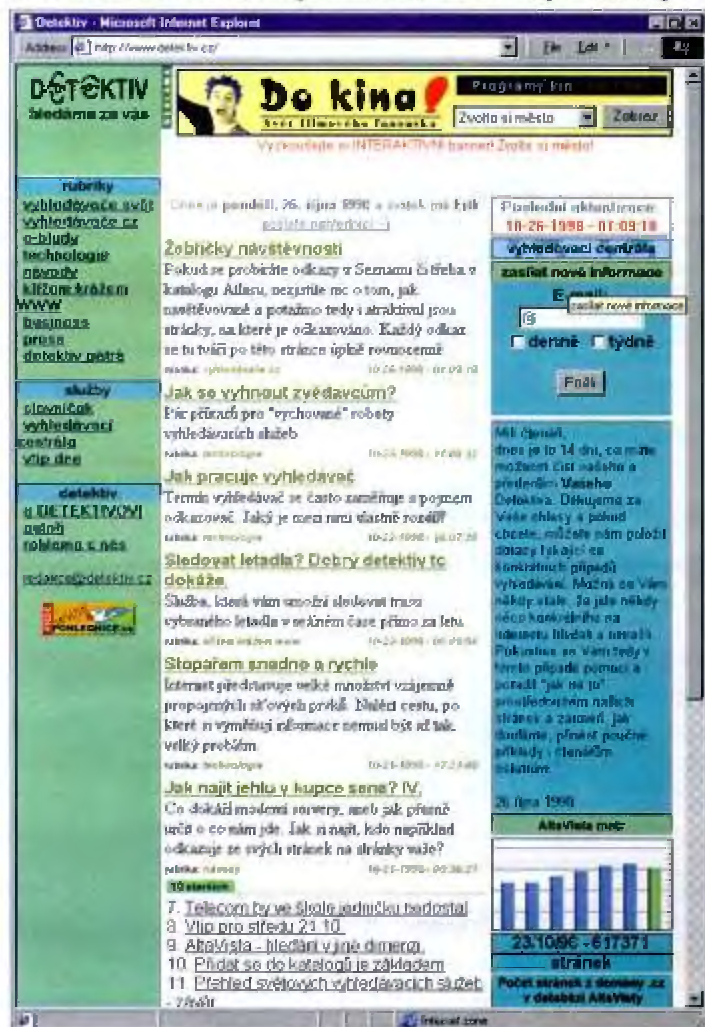
Obr. 1: Domovská stránka Detektiva

dokonce neexistuje ani žádná závazná centrální evidence, která by musela (či alespoň mohla) vědět úplně o všem, co je kde k dispozici. Místo ní existuje mnoho dílčích pokusů o evidenci toho, co je kde dostupné, a každá z těchto evidencí je v něčem jiná,