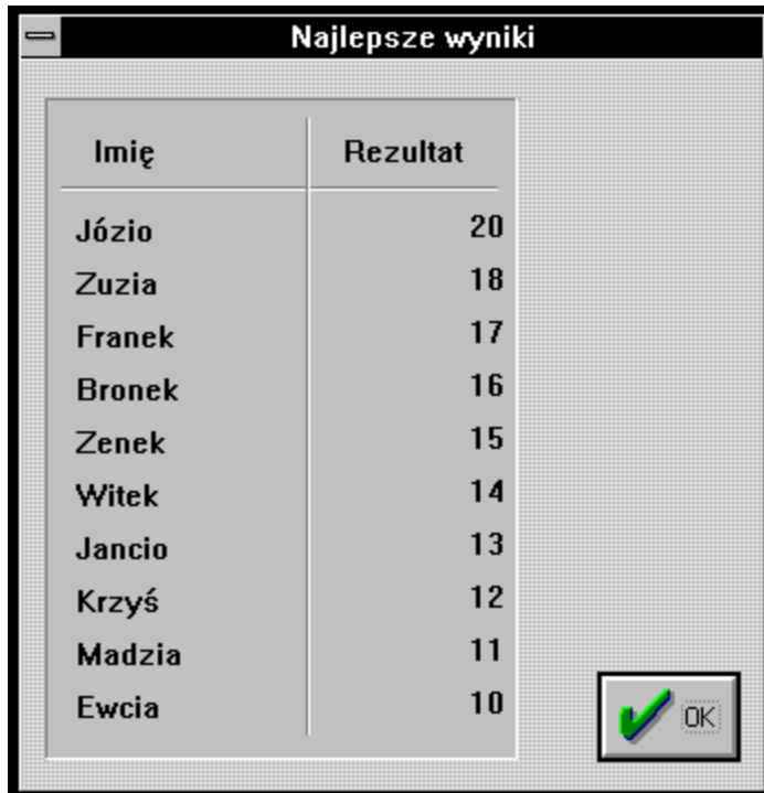
Tabela Najlepszych Wyników