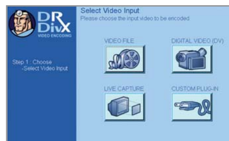
▲ Dr.DivX 1.0.6 — наиболее подходящий вариант для кодирования в формате DivX

DivX дает возможность использовать так называемое однопроходное и двух-