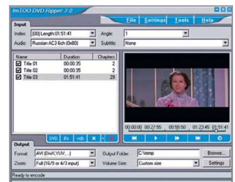
▲ ImTOO DVD Ripper 2.0: широкие возможности по работе с субтитрами

Имейте в виду, что, если вы отключите опцию сжатия звука, для завершения конвертирования вам необходимо будет использовать еще как минимум две программы — для кодирования аудиодорожки и для синхронизации звука и видео. »