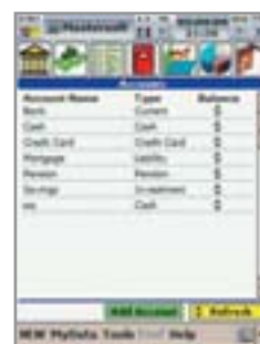
▲ Информация о состоянии активов всегда на виду