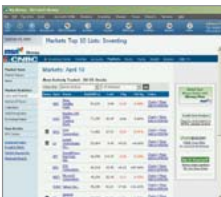
▲ Работа с акциями может быть проста и понятна