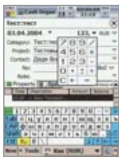
▶ Провод информации о платеже через базу программы