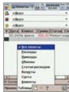
◀ Непривычный интерфейс DISCO не совсем удобен в работе