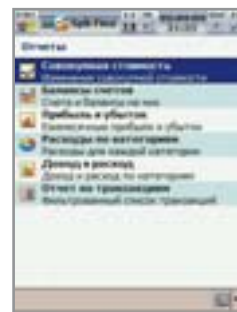
▲ Заглавная страница отчетов поможет быстро сориентироваться

стольной программой. Не поддерживается обратная синхронизация статей бюджета, созданных на КПК. В остальном же SPB Finance является прекрасным примером качественной и полноценной программы финансового учета на КПК и, несомненно, заслуживает внимания.