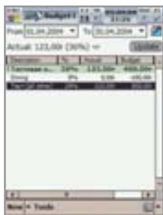
◀ Поддержание информации о бюджете в актуальном состоянии

Утилита обладает всеми необходимыми функциями: контроль сразу над несколькими счетами, категориями и проектами. Планирование будущих транзакций и бюджета. Прогнозирование финансового результата на заданную дату. Кроме того, с ее помощью вы сможете создавать отчеты в различных формах представления. Экспортировать данные в форматы CSV, QIF и из них же импортировать в программу. »