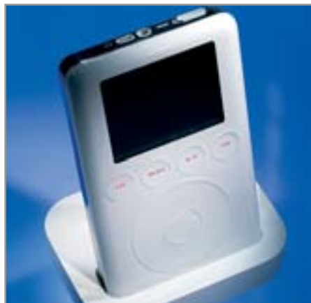
▲ Элегантная док-станция идеально сочетается с плеером iPod

Уменьшенные по сравнению с предыдущей моделью габариты и вес делают этот плеер стоимостью $450 самым маленьким с 2,5-дюймовым винчестером. Однако не все подверглось в нем миниатюризации: размеры дисплея, наоборот, увеличены, а жесткий диск на 60 Гбайт позволяет создавать громадные архивы музыкальных записей. За $380 можно купить недавно вышедшую 30-гигабайтную модель Creative Zen Xtra с аналогичными характеристиками. Она по соотно-