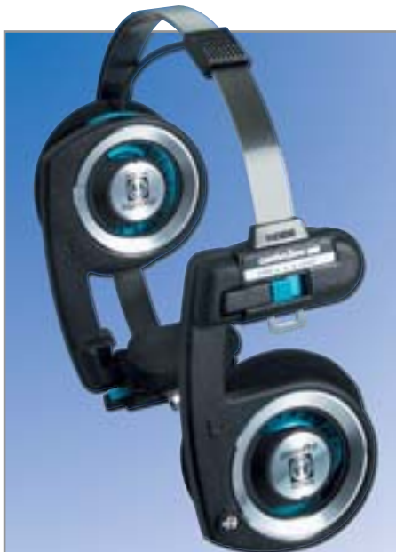
▲ Koss Porta Pro демонстрируют, какой должна быть музыка