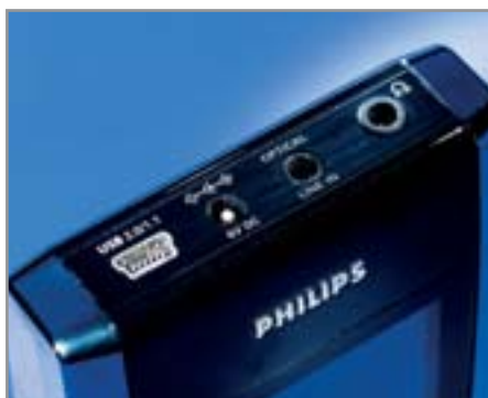
▲ Philips HDD 100 имеет аналоговый и цифровой входы

Данный плеер можно использовать в качестве диктофона, накопителя для загрузки фотографий (плеер оснащен карт-ридером CF), а также записи радио. Помимо этого, функциональные возможности Gmini можно расширить за