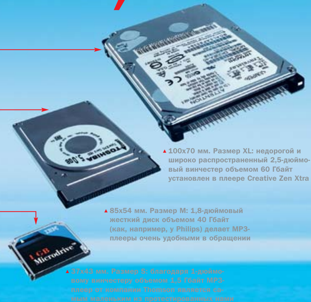
▲ 100x70 мм. Размер XL: недорогой и широко распространенный 2,5-дюймовый винчестер объемом 60 Гбайт установлен в плеере Creative Zen Xtra