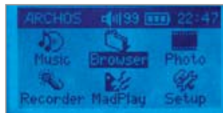
▲ Браузер плеера Archos Gmini 120 упрощает работу с файлами

Если в данном плеере использовать декодер MP3Pro, то продолжительность звучания (при некотором ухудшении качества высоких частот) увеличится примерно наполовину. Правда, и с другими кодеками Thomson не выдает частоты выше 15 кГц, попросту срезая их. К тому