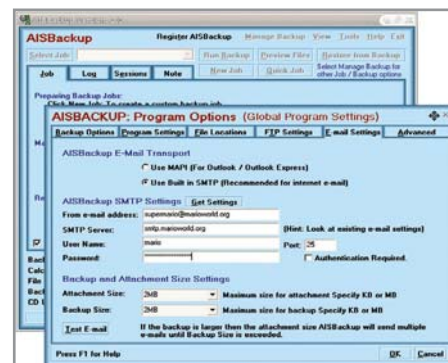
▲ AIS Backup может отправить резервную копию по почте

Backup Platinum имеет встроенный архиватор и может упаковывать каждый файл в отдельный архив или же создавать общие архивы. При желании резервные