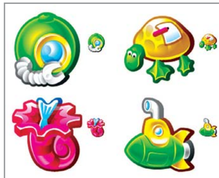
▲ Иконки Егора Гилева получили первый приз в конкурсе Pixelpalooza

Международная интернет-премия — www.worldwidewebawards.net . Один из самых авторитетных ресурсов в этой области. Критерии оценки ресурсов подробно описаны на странице www.worldwidewebawards.net/criteria.htm . Если вкратце, то сайты оцениваются по таким параметрам как грамотный HTML-код, интересное содержание и оригинальный дизайн, в соответствии с чем им присуждается определенное количество баллов. Сайты, набравшие свыше 100 баллов, признаются платиновыми, от 90 до 100 — золотыми, 80–89 — серебряными, 60–79 — бронзовыми, 60–100 — почему-то патриотическими.