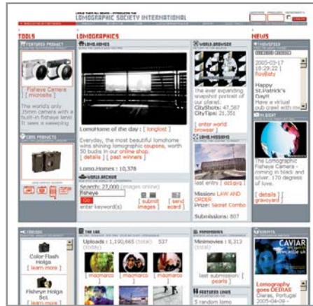
▲ Конкурс любительских фотографий, сделанных аппаратами ЛОМО

Соревноваться можно в чем угодно — от скоростной глажки и выполнения карточных фокусов до игры в крестики-