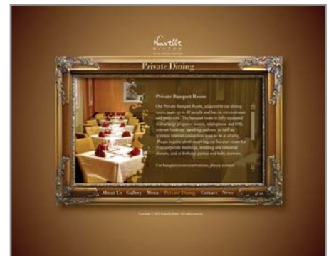
▲ Nouvelle Bistro — призер Международной интернет-премии 2005 года

В этой области также представлен большой выбор премий и конкурсов, в которых могут участвовать абсолютно все желающие. На конкурсах ваша фотография может заинтересовать посетителей сайта настолько, что ее приобретут даже в том случае, если призовое место досталось не вам: большинство зарубежных фотохостингов оснащены