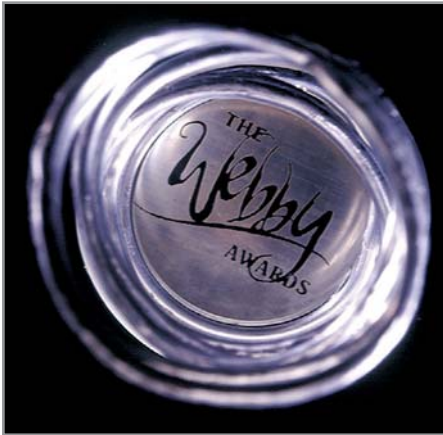
▲ The Webby Awards вручается в разных категориях с 1996 года

» сколько минут, а продать действительно хороший снимок достаточно просто.