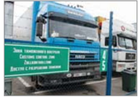
▲ Подозрительный товар может надолго застрять на таможне

Компания недавно отметила пятилетний юбилей, что выглядит неплохой гарантией ее стабильности. Вкратце расскажем о схеме работы. Вы выбираете товар в любом магазине, сообщаете об этом в pregrad.net, затем оплачиваете мини-