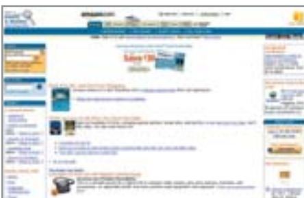
▲ Самый известный интернет-магазин — Amazon.com