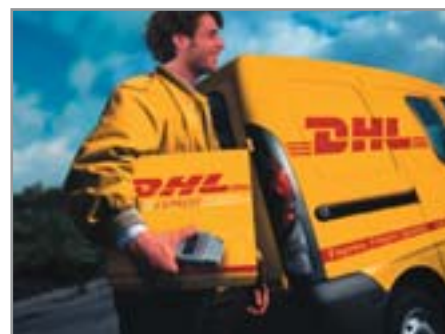
▲ Служба экспресс-доставки DHL возьмет на себя все хлопоты

Пластиковые карты — наиболее распространенный способ оплаты товаров или услуг, приобретаемых через Интернет.