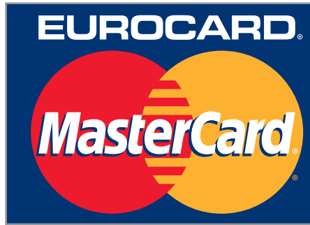
▲ Mastercard — универсальное платежное средство в Интернете

▶ Bank Account № — номер счета в банке. После оплаты и получения товара покупатель должен получить один из следующих документов, подтверждающих операцию: