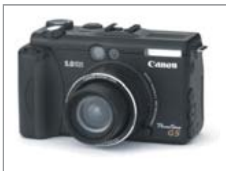
▲ На примере Canon G5 рассчитываем стоимость доставки

Помните, ваша посылка будет доставлена (по крайней мере, на территории России) обычной почтой — что это значит, думаем, объяснять не надо. Службы экспресс-доставки, такие как DHL, TNT, FedEx и другие, являются перевозчиками, таможенными брокерами, но не имеют права оформления международных почтовых отправлений. И в этом случае таможенное оформление будет заменено совокупным таможенным платежом (пошлина + акциз + НДС). Сбор за таможенное оформление при этом составят 0,15% от стоимости.