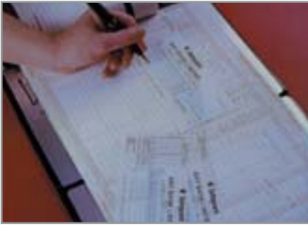
▲ Банковский чек — один из способов оплаты товара

совершения покупки, и на его лицевой стороне должен быть указан номер заказа. Если эта информация не указана, платеж будет возвращен.