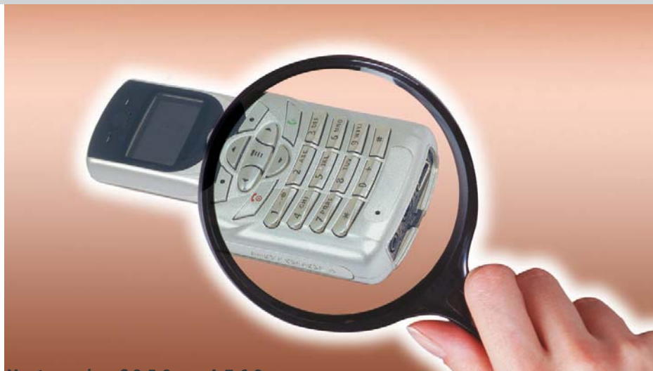
Motorola C350 и A760

Communication Express Новинки рынка коммуникаций 114