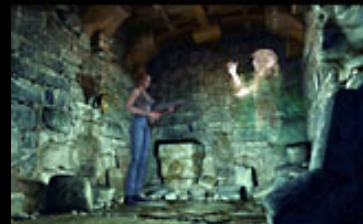
サイバーフロント

私立探偵のエドワードは、武器の扱いに長ける。反面、超常の人類学博士のアリーンは、その知識と直感が武器。反面、力は何も持たない。体力的にはやや劣る。