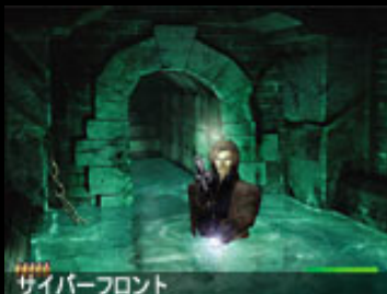
サイバーフロント