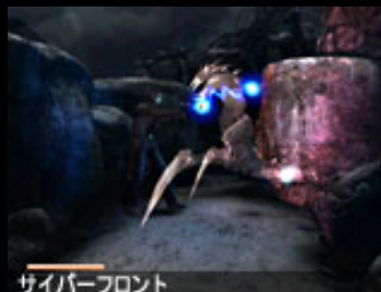
サイバーフロント

私立探偵のエドワードは、武器の扱いに長ける。反面、超常の人類学博士のアリーンは、その知識と直感が武器。反面、力は何も持たない。体力的にはやや劣る。