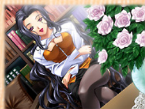
▲豪華な院長室で待っていたのは