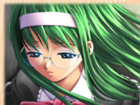
▲悲しげにうつむく少女の名は……