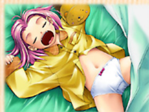
▲主人公の部屋でお泊まりみくる