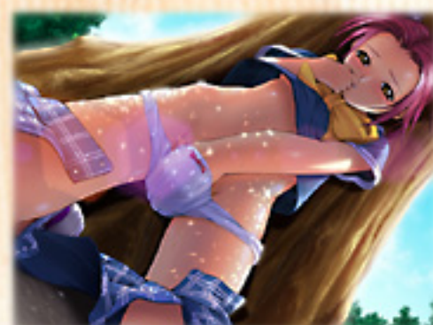
▲主人公と夏生の情事を見たみくるは……