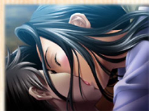
▲紗江子の大人のディープキス