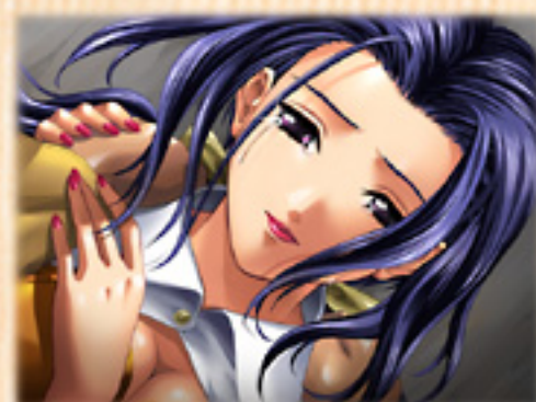
▲横たわる紗江子その涙のわけは？