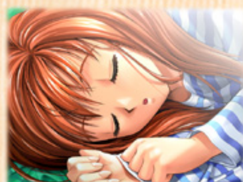
▲朝起きてみると隣にはなぜか彼女が