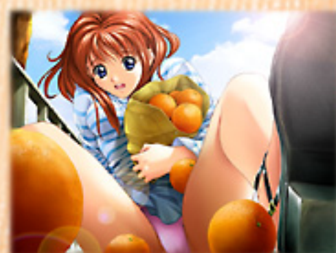
▲突然主人公にぶつかった女の子は……